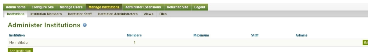
Slika 4. Popis institucija