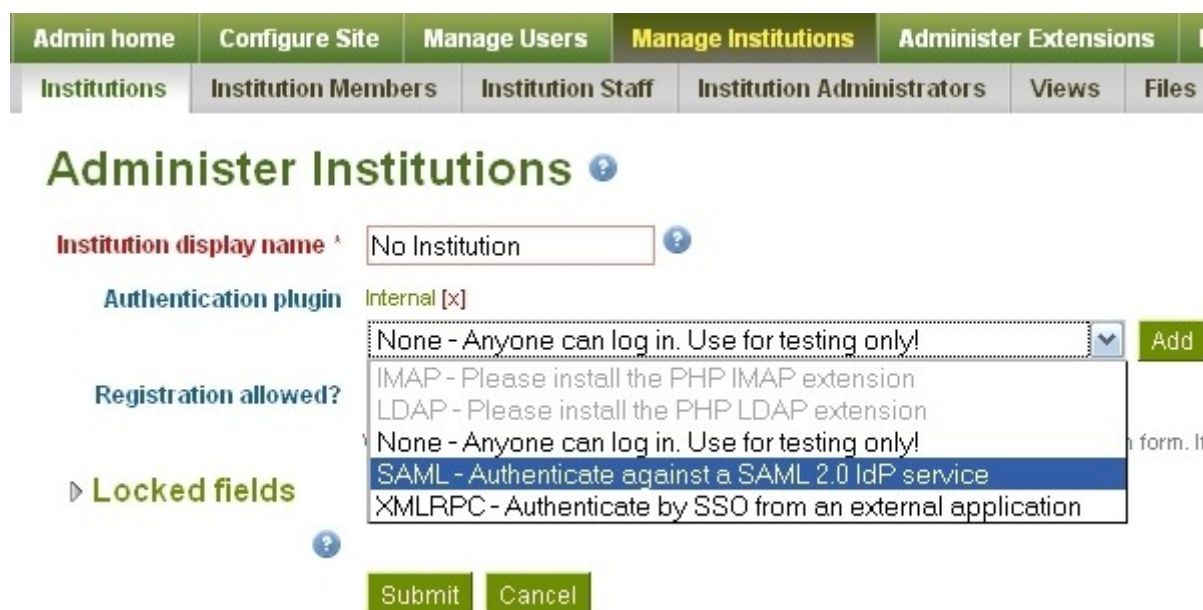
Slika 5. Dodavanje saml autorizacijskog plug-ina