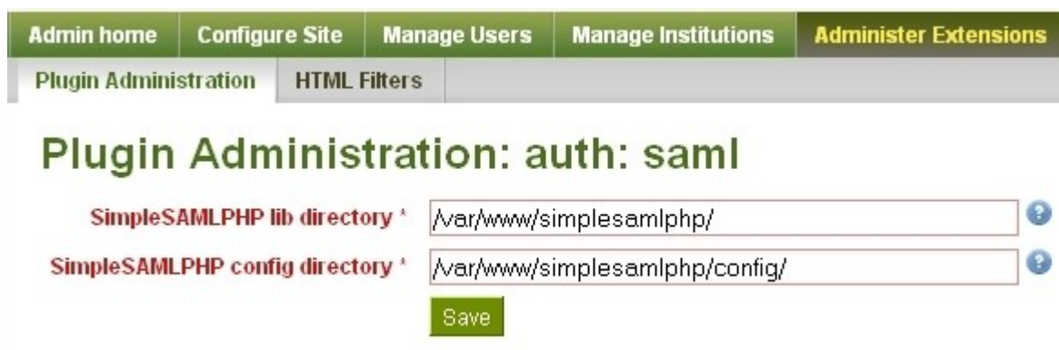
Slika 3. Konfiguracija saml plug-ina