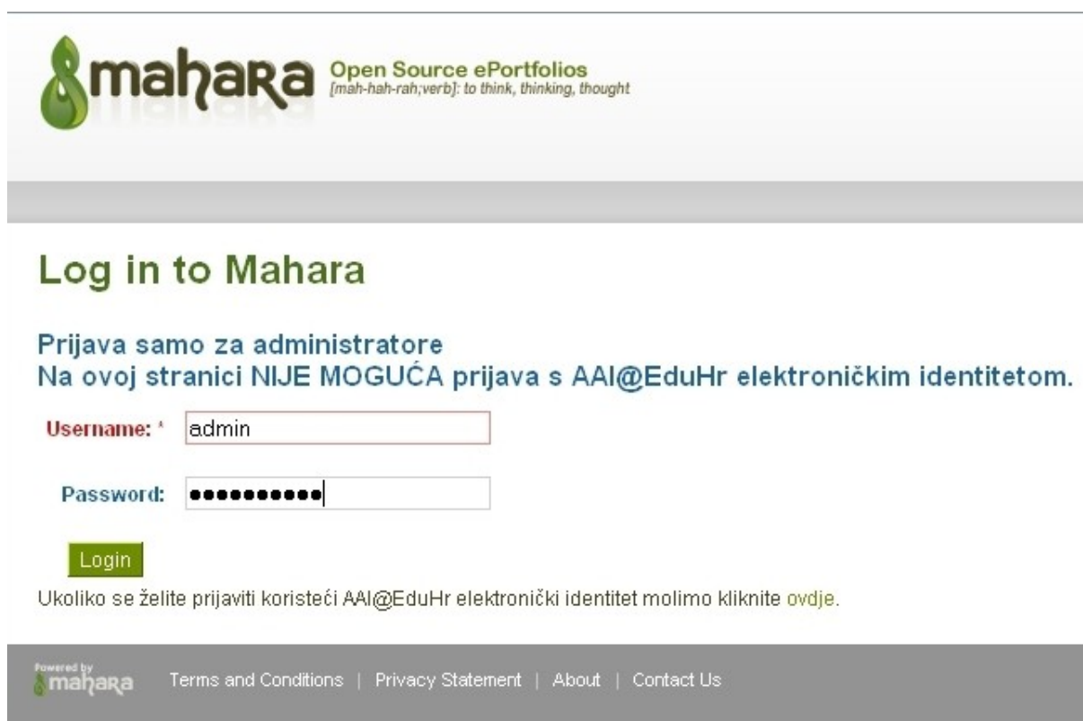
Slika 9. Stranica za prijavu s lokalnim korisničkim računom